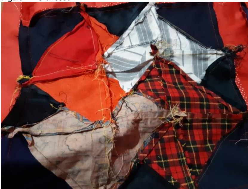
Figura 2 - O avesso

Sem uma alternativa, nem esperei minha vez, levantei-me do meu lugar próximo ao quadro e me sentei perto da janela. A professora estranhou meu comportamento e indagou por que eu havia mudado de lugar, respondi que não sabia a tabuada e, se era para ficar sem recreio, que ao menos eu ficasse perto da janela para ver as/os colegas brincando lá fora.