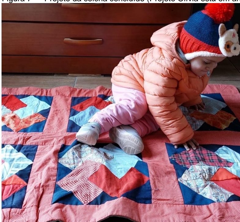
Figura 7 — Projeto da colcha concluído (Projeto Olívia está em andamento)

Ao chegar ao fim desta tese arremato os pontos dessa grande colcha que foi este escrito, repleto de conhecimento, descobertas e redescobertas, apreensão, perdas, dores, e muitas alegrias, assim como ilustra a Figura 7, com o projeto da colcha concluído: