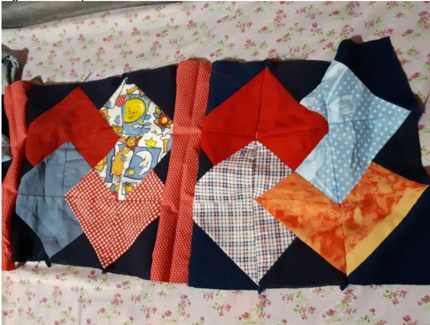
Figura 3 — O quadro vai tomando forma

Depois de quase cinco anos de concluído o curso normal prestei concurso para o magistério municipal, para a área rural. Nomeada, fui enviada para uma escola multisseriada, para uma turma de 4ª e 5ª série. Essa experiência me marcou profundamente, eu ainda tinha dúvidas da minha escolha, mas o contato com as crianças, as famílias e as colegas fizeram com que eu soubesse que havia feito a escolha certa.