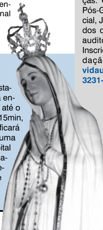
Imagem de Fátima

Durante todo o mês de maio, as participantes do curso de manicure promovido pela Fijo precisam de modelos. O atendimento é gratuito e ocorre às segundas-feiras, das 9h às 12h e das 13h às 16h, e às terças-feiras, das 9h às 12h.