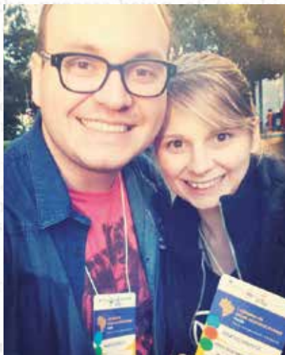
1ª Jornada de Saúde Multidisciplinar #enfermeiro, #psicóloga, #interdisciplinaridade, #mundopucrs, #culturada paz, #diversidade