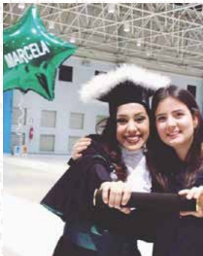
Daqui a pouco serás tu "enfermeirando" por aí #mundopucrs