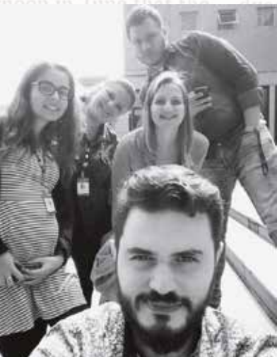
Lagarteada após o almoço #sun, #work, #mundopucrs