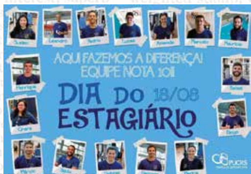
Parque Esportivo via Instagram