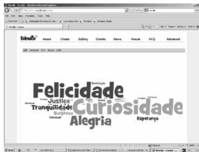
Figura 2 – Os sentimentos otimistas que produzem a esperança

As imagens apresentadas a seguir exemplificam um instante ‘congelado’ deste fenômeno que em essência é cinético. As imagens mostram os sentimentos otimistas (positivos) gerados pelas 11 notícias da amostra entre os respondentes, os sentimentos tóxicos e o choque entre ambos, algo que deriva da convivência pouco amistosa que se estabelece entre emoções antagônicas.