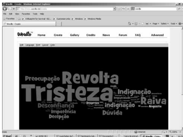
Figura 4 – O choque das emoções