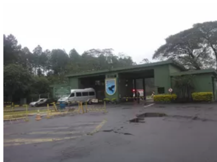
Pouso ocorreu na base aérea de Canoas

Um voo da Azul, que havia decolado de São Paulo para Porto Alegre , apresentou problemas técnicos na noite desta sexta-feira (29). Com isso, o piloto teve de fazer um pouso de emergência na base aérea de Canoas, na Região Metropolitana, por volta de 23h30.