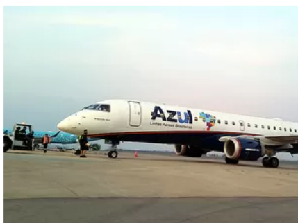
Avião da Azul Linhas Aéreas

A Azul Linhas Aéreas Brasileiras desmentiu informações divulgadas pela imprensa nesta quarta-feira (1) de que estaria cogitando demitir 700 pessoas. “Isso não procede. Ações como essa não fazem parte da cultura da companhia e nem de seu fundador, David Neeleman, que ao longo de sua trajetória esteve à frente de outras três aéreas e nunca realizou demissões”, informou por meio de nota.