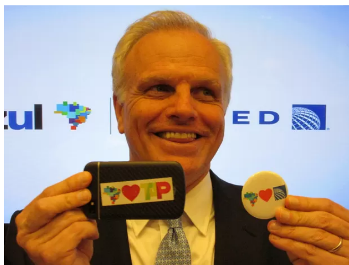
CEO e fundador da Azul, David Neeleman

David Neeleman, fundador e CEO da Azul Linhas Aéreas de 55 anos e o novo nome por trás TAP-Portugal, está colecionando novos amores. Dois dias após assinar em Portugal o contrato da privatização da TAP, o empresário anunciou em São Paulo acordo com a United Airlines, no qual a companhia norte-americana investirá comprará 5% do capital da empresa brasileira por US$ 100 milhões.