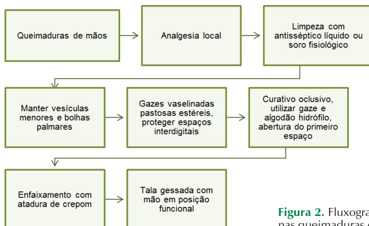
Figura 2. Fluxograma de condutas nas queimaduras de mãos. [1]