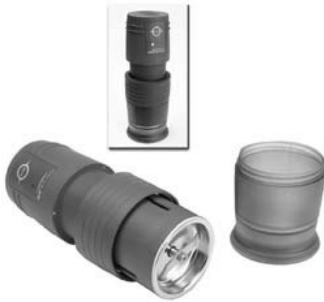
Figure 1. IKA Works A11 Basic Mill (IKA do Brasil, RJ, Brazil)