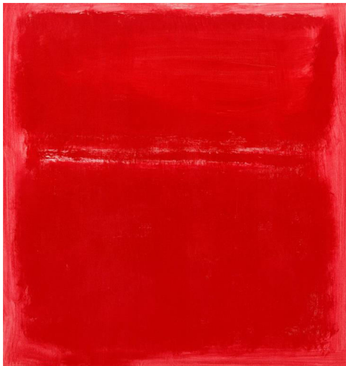
Figura 2 - Sem título

(1970)