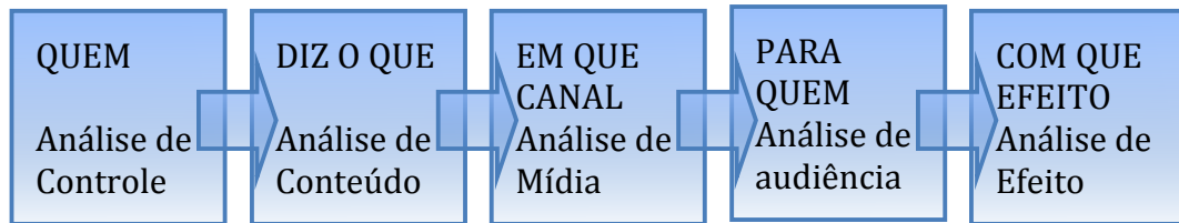
Figura 2.8. Definições de Laswell

O paradigma de Laswell foi produto de sua época e de um ambiente acadêmico dominante do século passado, nos anos 1930, nos Estados Unidos, respondendo a determinadas condutas da psicologia daquele momento. O paradigma sofre algumas críticas, como o fato de haver insistido na necessidade de considerar a comunicação como um processo, e não no como um ato que permita o desenvolvimento de diversas relações. Além disto, há uma predisposição em assegurar que o emissor sempre gera um efeito sobre a audiência, desconsiderando um conhecimento prévio desta mesma plateia. O paradigma provoca uma segmentação excessiva dos componentes da comunicação e acaba pressupondo uma direção única da comunicação, sem incorporar nenhum elemento de resposta ou feed-back (SAPERAS, 1992, p. 79).