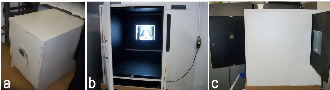
Figura 1 - Dispositivo auxiliar de digitalização de imagens a) Vista com máquina digital acoplada, b) vista com porta frontal aberta, c) vista lateral, entrada para filme radiográfico.

Utilizando o programa Adobe Photoshop CS2 (Adobe System Inc., San Jose, California, Estados Unidos da América), as imagens digitalizadas foram salvas em formato JPEG e ajustadas para escala cinza. Brilho e contraste foram ajustados para tornar a imagem digitalizada similar ao filme radiográfico. Todo o procedimento de digitalização e manipulação das imagens foi realizado por profissional que possui experiência prévia em radiologia.