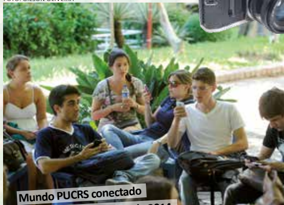
Mundo PUCRS conectado na volta às aulas de 2014