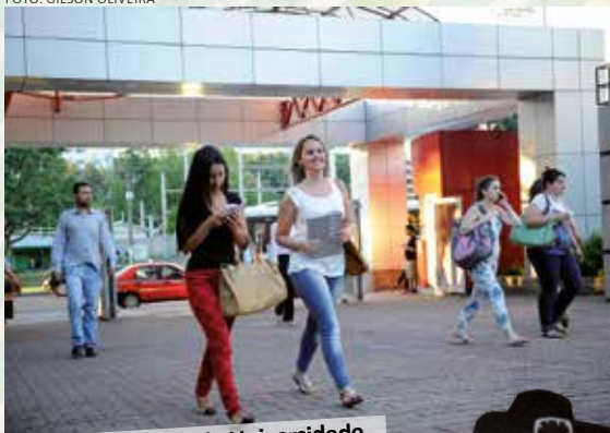
Na entrada da Universidade, a caminho da sala de aula