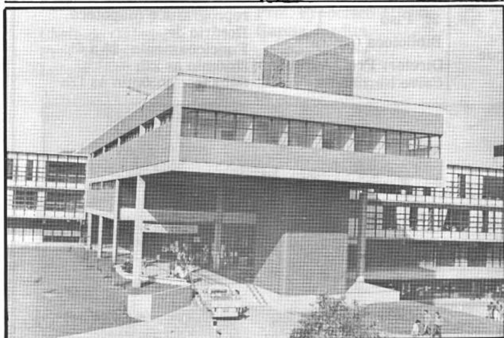
Centro de Ciências e Tecnologia

Aberto à comunidade universitária, tem encontros aos sábados à tarde.