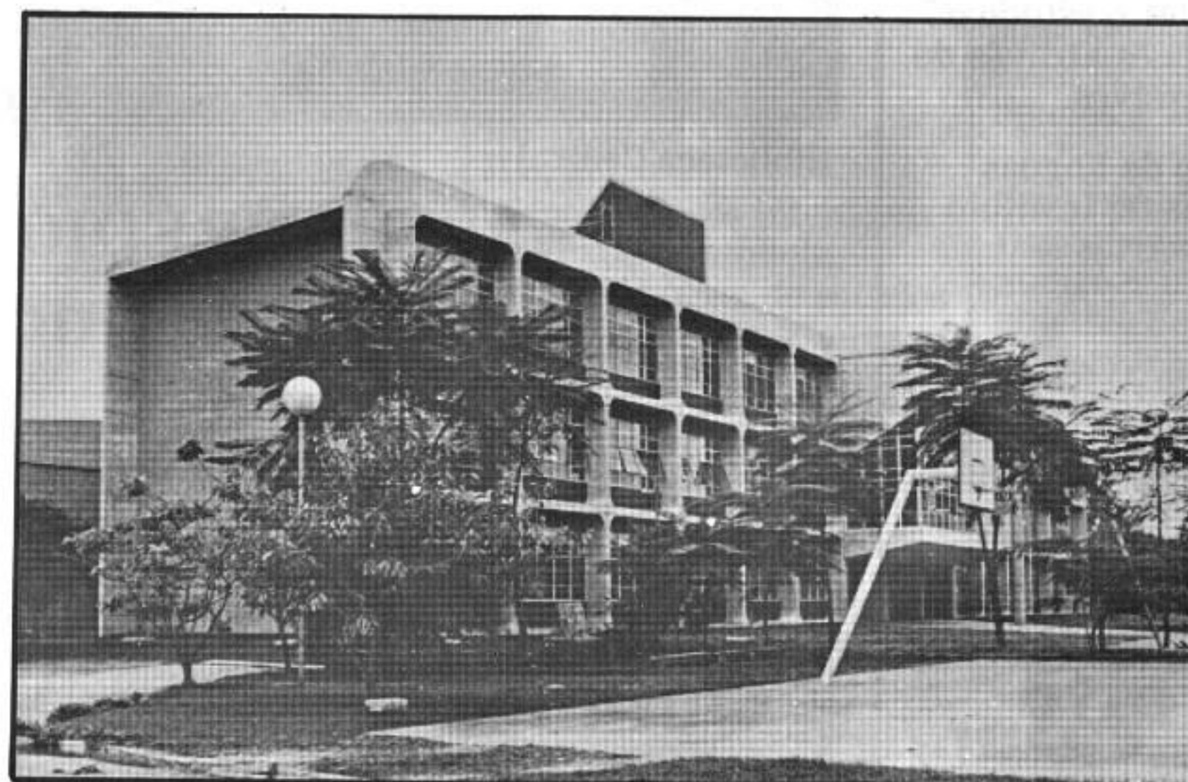
Ginásio de Esportes

Realiza manutenção dos equipamentos audiovisuais e demais equipamentos eletrônicos da Universidade.