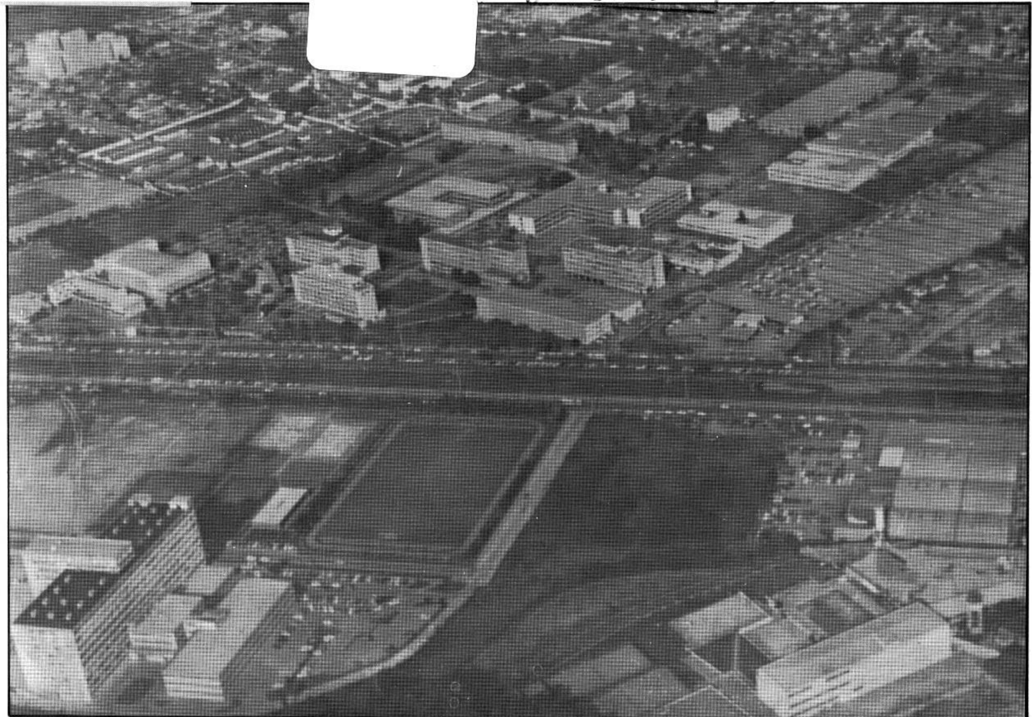
A Cidade Universitária: mais de 20 mil alunos, 1.600 professores, 500 funcionários.

EDIÇÃO ESPECIAL Para ser distribuída aos aprovados no vestibular de julho de 86