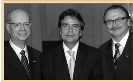
Joaquim Clotet, José Temporão e Jaderson Costa

No dia 8/12 foi anunciado, no Palácio Piratini, um convênio com o Ministério da Saúde e a Secretaria da Saúde do RS para a construção do prédio do Instituto do Cérebro (InsCer) da PUCRS, que será instalado próximo ao Hospital São Lucas. Participaram da cerimônia o ministro da Saúde, José Temporão, a governadora Yeda Crusius, o Reitor Joaquim Clotet, o diretor do InsCer, Jaderson Costa, entre outras autoridades. O complexo do Instituto terá o Centro de Diagnóstico e Pesquisa de Imagem Molecular, incluindo a tomografia por emissão de pósitrons (PET-CT), que disponibiliza imagens detalhadas do cérebro. Serão destinados, pelo Ministério da Saúde, R$ 7,5 milhões para a construção do prédio e R$ 13,8 milhões para equipamentos (via