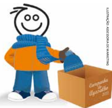
ILUSTRAÇÃO: ASSESSORIA DE MARKETING

No dia 7/6, às 11h30min, ocorrerá o encerramento da Campanha do Agasalho 2013, com a Celebração Eucarística na Igreja Universitária Cristo Mestre. É esperada a participação da comunidade universitária, especialmente, o Grupo de Representantes da Pastoral