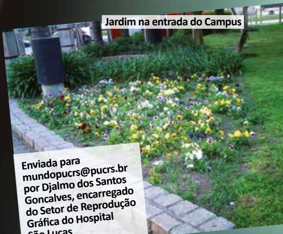
Jardim na entrada do Campus