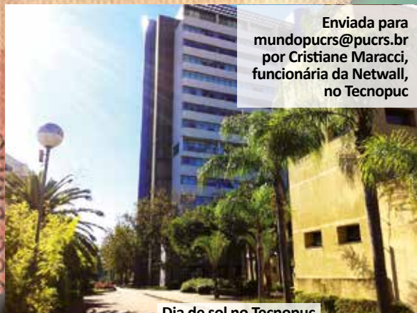
Dia de sol no Tecnopuc

Enviada para mundopucrs@pucrs.br por Cristiane Maracci, funcionária da Netwall, no Tecnopuc