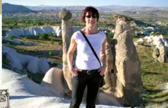
Viagem à Capadócia, em 2010