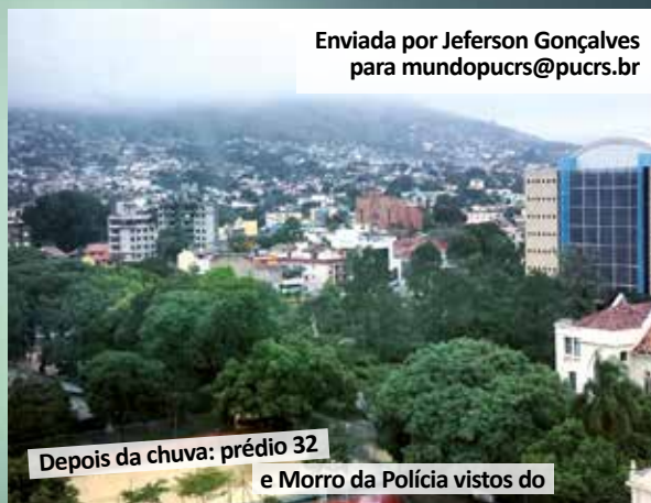
Depois da chuva: prédio 32

Enviada por Jeferson Gonçalves para mundopucrs@pucrs.br