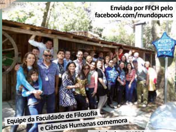
Equipe da Faculdade de Filosofia e Ciências Humanas comemora