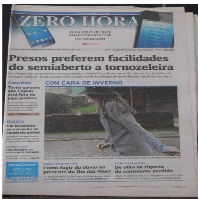
Figura 4. Capa do ZH do dia 08 de maio de 2013: Presos preferem facilidades do semiaberto a tornozeleira.

Através da figura abaixo, pode-se notar que a discussão sobre a implantação do monitoramento eletrônico mereceu destaque em relação aos outros temas que compõem a capa do ZH do dia 08 de maio, pois a forma de diagramação do título dá ênfase ao tema, o qual aparece em letras grandes e em negrito na parte superior da página.