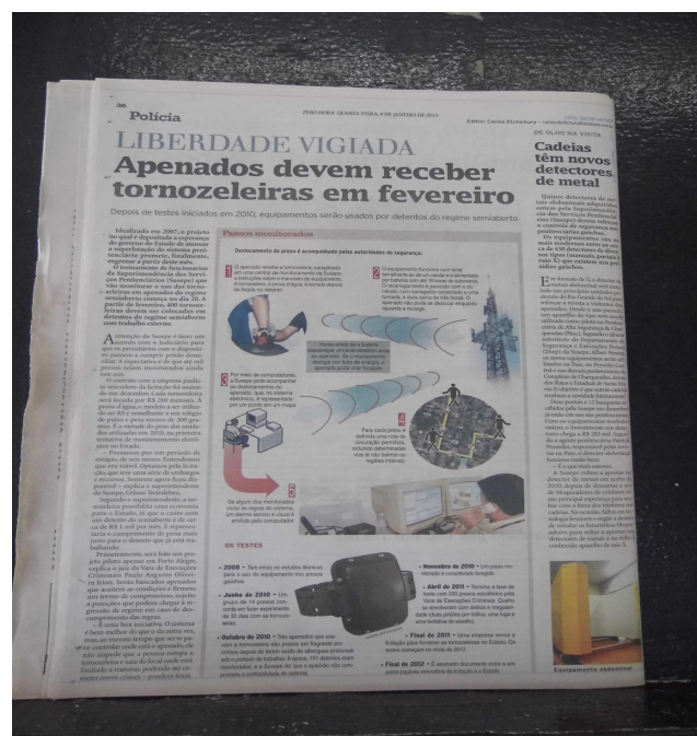
Figura 2. Reportagem do ZH dia 09 de janeiro de 2013: Liberdade vigiada.

A seguir, será analisado o discurso da reportagem completa, situada na página 36 da seção policial. A reportagem é intitulada “Liberdade vigiada” (anexo B), com a seguinte chamada: “Apenados devem receber tornoeleiras em fevereiro”. Conforme pode ser observado através da figura abaixo, na reportagem, existe um apelo para leitura visto que os títulos aparecem em destaque por meio da escrita em letras com fontes variadas e em negrito.