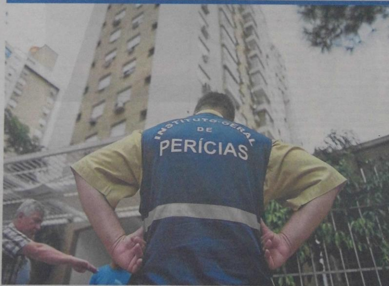
Peritos dizem que portão e toda a grade de prédio na Capital onde mulher morreu ao levar choque estavam energizados. Págs. 4 e 5