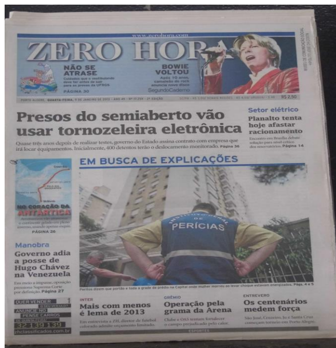
Figura 1. Capa do ZH do dia 09 de janeiro de 2013: Presos do semiaberto vão usar tornozeleira eletrônica.

A escolha desse tema, que aparece em destaque de capa, marca locutor-jornalista, pois parece demonstrar seu interesse pelas questões da segurança pública. Essa observação surge da ideia de que, certamente, deveriam existir outros acontecimentos importantes no dia 09 de janeiro de 2013 que poderiam servir de chamada de capa. Através de tal escolha, ainda se percebe que o locutor-jornalista projeta em seu discurso um interlocutor que se interessa pelo assunto, de modo que o destaque da capa chamará sua atenção para a leitura da reportagem. Nesse viés, nota-se que localização da reportagem no jornal parece representar uma estratégia, na medida em que o leitor é conduzido a fazer outras leituras até chegar à página desejada.