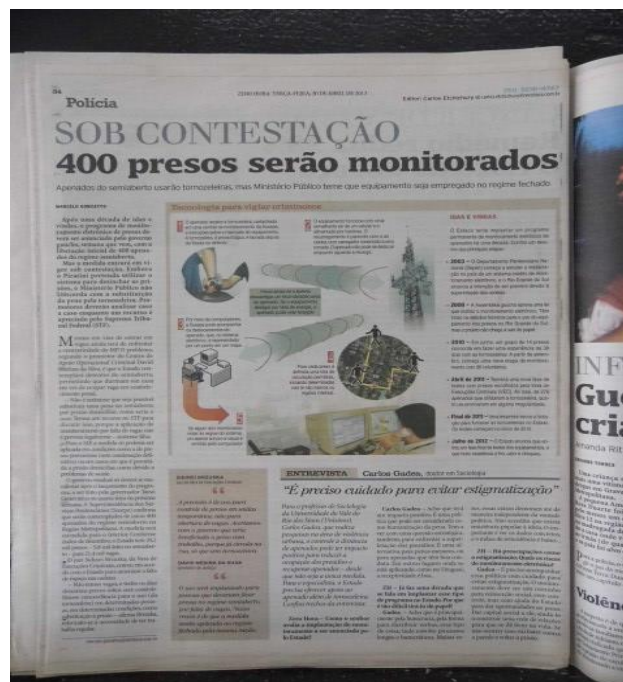
Figura 3. Reportagem do ZH do dia 30 de abril de 2013: Sob contestação.

apenas a página nº 34 da seção policial do Jornal Zero Hora. A notícia recebeu o título “Sob contestação”, vindo acompanhado da seguinte chamada: “400 presos serão monitorados”. Abaixo da chamada, foi lançada uma breve explicação sobre o conteúdo da reportagem: “apenados do semiaberto usarão tornozeleiras, mas Ministério Público teme que equipamento seja empregado no regime fechado”. Os elementos linguísticos que compõem o cabeçalho da reportagem foram configurados com diferentes fontes e dimensões, o que atrai a atenção do leitor.