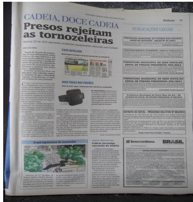
Figura 5. Reportagem do ZH dia 08 de maio de 2013: Cadeia, doce cadeia.

A seguir, serão analisados os elementos constitutivos da reportagem 3 situada na página 34 da seção policial do ZH (anexo E). A reportagem recebeu o título “cadeia, doce cadeia”. Abaixo do título, há a seguinte nota: “presos rejeitam as tornozeleiras”. Através da figura abaixo, percebe-se que sua construção discursiva é composta em partes: a coluna da esquerda apresenta a notícia sobre a falta de adesão dos presos em participar do projeto de monitoramento eletrônico, cuja informação estende-se até a parte inferior da página; a parte superior apresenta uma figura que ilustra uma reportagem publicada pelo ZH em janeiro que aborda o descontrole dos institutos penais de regime semiaberto; e o centro da página traz uma nota sobre a tornozeleira eletrônica, juntamente com uma figura do equipamento.