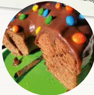
O campeão de pedidos da Vai Dar Bolo: chocolate com nutella