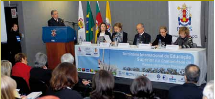
Acadêmicos dos Países de Língua Portuguesa debateram na PUCRS

R epresentantes de instituições de ensino superior, de órgãos públicos e de entidades não governamentais da Comunidade dos Países de Língua Portuguesa (CPLP) analisaram e debateram, durante o Seminário Internacional de Educação Superior na CPLP, em maio, na PUCRS, as perspectivas de produção de conhecimento. A vice-presidente do CNPq, Wrana Panizzi, ressaltou, na abertura, que estabelecer um novo modelo pressupõe heterogeneidade, referindo-se à integração entre os ambientes acadêmico, empresarial, governamental e não governamental. O presidente da Comissão de Organização da Universidade da Integração Internacional da Lusofonia e Integração Afro-Brasileira (Unilab), Paulo Speller, mostrou o desenvolvimento dessa nova instituição de ensino superior. Informou que diversas ins-