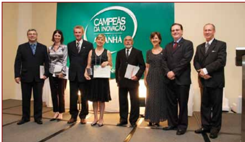
Equipe da PUCRS recebeu prêmio dedicado à inovação

A PUCRS foi agraciada pela Associação Nacional de Pesquisa e Desenvolvimento das Empresas Inovadoras (Anpei) com um novo título em reconhecimento ao seu caráter inovador. Além da Universidade, mais 47 empresas e instituições associadas à Anpei, como Eletrobrás, Rhodia, Instituto Inovação e PUC do Paraná, receberam a distinção. O Selo Anpei de Empresa Inovadora, lançado em 2008, busca reconhecer as empresas e instituições de ciência, tecnologia e inovação associadas que investem em pesquisa, desenvolvimento e inovação no Brasil. Para concedê-lo, a Anpei realiza um processo de avaliação que leva em conta crité-