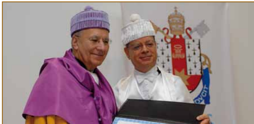
Michel Maffesoli (E) recebeu maior distinção honorífica da Academia

O pensador da Pós-Modernidade e da Sociologia do Cotidiano Michel Maffesoli entrou para a galeria dos agraciados com o título de Doutor Honoris Causa da PUCRS, que exalta a contribuição do intelectual francês para a formação de doutores de norte a sul do País e o estreito vínculo com a Faculdade de Comunicação Social (Famecos). No seu discurso, vestindo a sua toga da Universidade Paris Descartes - Sorbonne, Maffesoli enfatizou o papel das universidades desde os seus primórdios na formação do sentido das coisas, no compartilhamento do saber e contra os dogmatismos. O sociólogo, conhecido pesquisador na Europa, Ásia e América Latina, é referência nas Faculdades de Comunicação. É considerado o teórico da comunicação e do laço social