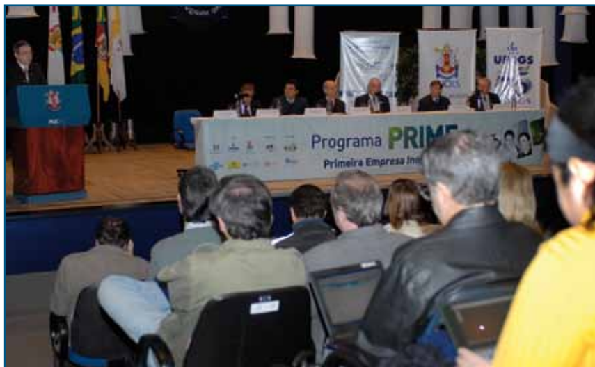
Abertura da seleção reuniu autoridades e centenas de empreendedores

A Incubadora Raiar, uma das 17 selecionadas pelo governo federal, recebeu 287 inscrições de empresas nascentes (com até 24 meses), o terceiro maior volume do Brasil, para disputar as vagas do Programa Primeira Empresa Inovadora (Prime), um dos mais concorridos programas de recursos públicos não reembolsáveis de incentivo ao empreendedorismo. Iniciado em março, com desenvolvimento até final do ano, o processo selecionou, em definitivo, 58 empreendimentos. Estes tiveram direito à primeira de