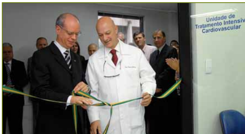
Hospital São Lucas ganhou UTI CV, com avançadas tecnologias

O Hospital São Lucas da PUCRS inaugurou a nova Unidade de Tratamento Intensivo Cardiovascular (UTI CV). A área, localizada no terceiro andar da instituição, passou por reforma completa, com a modernização de equipamentos e da estrutura física, o que possibilita mais conforto e privacidade aos pacientes, a maior parte oriunda do Sistema Único de Saúde (SUS). A UTI CV substituiu a antiga Unidade de Tratamento Intensivo Coronariano (UTC), fundada há 20 anos, sendo uma das poucas no Rio Grande do Sul destinadas especificamente ao tratamento do infarto agudo do miocárdio. A obra permitiu a ampliação do espaço físico, que passa a abrigar uma sala de espera e acolhimento