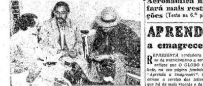
José Tenório de Albuquerque falando a O GLOBO, sentado ao lado, sentado e de cabeça, o deputado Tenório Cavalcanti. A esse perfil que está está vestido com seu fardo vermelho e é - segundo exploração - à prova de fogo - chabou...

Os pára-quadristas, com o repórter d'O GLOBO, rumam, por sua vez, para Arraunacema, esperando lembrar-se ainda hoje no local da catástrofe - O Ministério da Aeronáutica não fará mais restrições (Texto na 6.ª pág.)