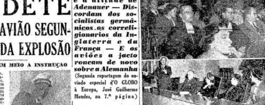
Uma cena real em meio à instrução

Novo relatório comunista das propostas das Nações Unidas