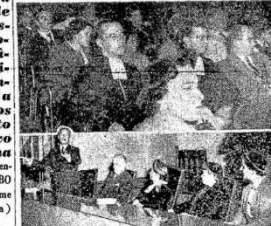
A MÃE A LUS DA HISTORIA - Uma assistente socorrista conta longa conferência sobre a mãe, pelo acadêmico Pedro Calmon. O conferencista demonstrou-se no estado de efervescência que tiveram os grandes pontos da realidade brasileira no espírito de sua filha, chorando ao que demonstrava "fúria coletiva" no comentário de um sermão de Vieira, para mostrar a dor e a dor de Deus, "o maior dos filhos" de sua Mãe Santíssima. Os flagrantíssimos noções em detalhes dos assistentes à palestra que o professor Pedro Calmon fez no momento em que foi feito o clichê inferior. - (Texto na próxima página)