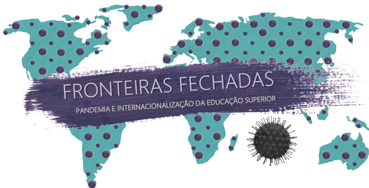
Figura 2: Fronteiras fechadas no mundo

Agora, mais do que nunca, se materializou uma condição da pandemia relacionada as fronteiras fechadas, conforme é possível identificar na figura 2, que impacta diretamente nas ações de mobilidade do PrInt que estavam previstas para 2020.