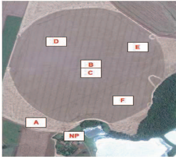
Figura 1 Mapa de instalação dos sensores em área agrícola irrigada.

posicionados a uma distância de 200m do centro respeitando o limite de raio. Já os nodos B e C (um substituiu o outro no período) ficaram a 9m do centro da área.