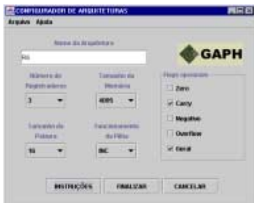
(a) Definição de parâmetros da arquitetura

fixo de palavra igual a 16 bits. A pilha pode ser pós-incrementada (da posição de memória com endereço menor para a posição de memória com endereço maior) ou pré-decrementada (da posição de memória com endereço maior para a posição de memória com endereço menor).