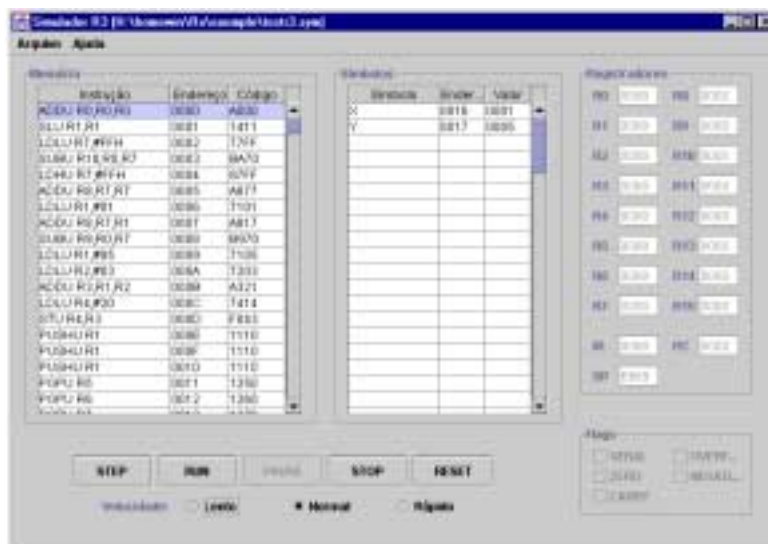
Figura 6 – Janela do simulador.

inserida a tabela de símbolos, onde são apresentados o nome do símbolo, seu endereço de memória e o seu valor. À direita da figura estão localizados os registradores de uso geral e os registradores IR, PC e SP. Na parte inferior são ilustrados os botões de controle Step , Run , Pause , Stop e Reset e as opções de velocidade Lento , Normal e Rápido . Os qualificadores de estado encontram-se na parte inferior à direita.