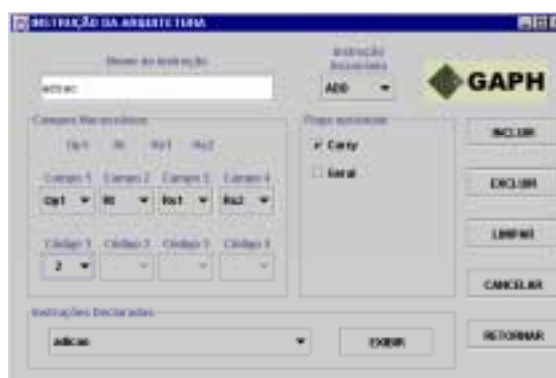
(b) Configuração das instruções