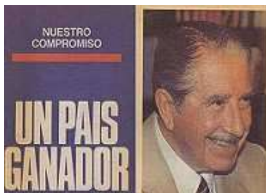
Figura 3- Logo da campanha do Si

Com o objetivo de suavizar a imagem de Augusto Pinochet, o programa de televisão governista apresentava o ditador como o bom velhinho . Mesmo que o governo estivesse desgastado na opinião pública, ainda era bastante explorada a imagem de Pinochet junto ao povo, abraçando especialmente crianças e idosos.