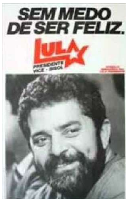
Figura 6- Logo Lula (1989)

A campanha de Lula, de 1989, apresentava na linguagem e estética dos materiais publicitários que remetia ao PT tradicional. O slogan Sem medo de ser feliz, apesar de agradar às esquerdas, ativava o medo perante o eleitor mais moderado.