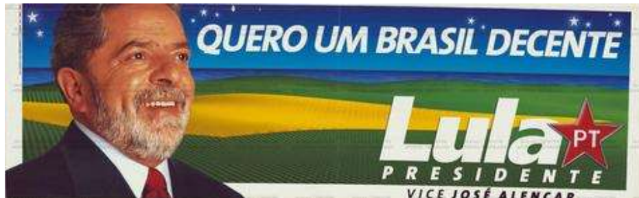
Figura 7- Logo Lula (2002)

Outra mudança importante, realizada por Mendonça, principalmente se comparado à campanha de 1989, envolveu os materiais publicitários da campanha. O vermelho, branco e amarelo, passaram a dividir o espaço com o azul. Outro aspecto importante foi a substituição de palavras de ordem como “coragem de mudar” por frases mais leves : “quero um Brasil decente”.