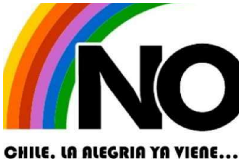
Figura 4- Logo da campanha do No utilizado no plebiscito