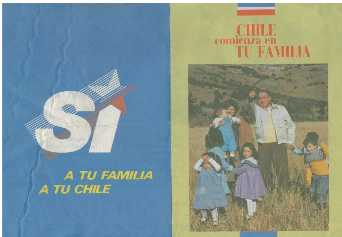
Figura 2- Panfleto da campanha do Si

Outro aspecto utilizado pela campanha situacionista foi a tentativa de construir a ideia que o Chile vivia uma democracia durante o regime de Pinochet. Frases como “Você decide”, “A escolha é sua”, “Você tem o direito de escolha” eram constantemente utilizadas na propaganda eleitoral.