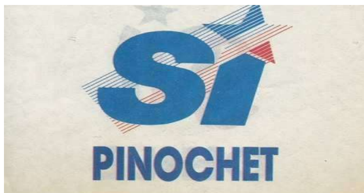
Figura 1- Logo da campanha de Pinochet para o plebiscito de 1988

A campanha do Si utilizou, na televisão, a narrativa de un país ganador contra o perigo vermelho. Além de explorar a narrativa anticomunista contra o No , a campanha do Si utilizava o medo da suposta desordem social, em caso de vitória da oposição.