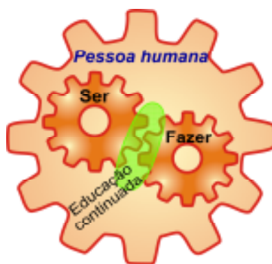
Figura 1 - Entrelaçamento do Ser e do fazer

possível perceber, nessa fala, a imbricação entre o ser e o fazer. Fica evidente que, se olhar para o profissional, aspectos precisam ser mudados no eu e, quando se olha o eu, o profissional precisa ser diferente. Então, a fala anterior mostra que há uma intersecção, apontando que a educação continuada age exatamente na essência da pessoa. O eu se exterioriza em qualquer profissão, em qualquer fazer.