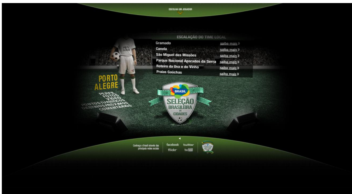
Imagem 11 – Página de visualização dos destinos próximos de Porto Alegre