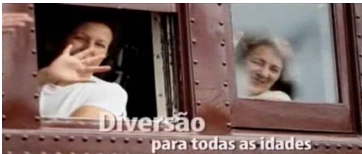
Imagem 9 – Trecho do vídeo sobre Porto Alegre e Região Serrana – “Diversão para todas as idades”