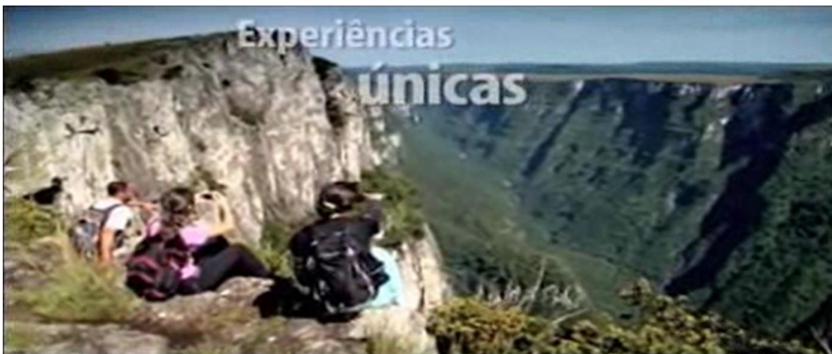
Imagem 8 – Trecho do vídeo sobre Porto Alegre e Região Serrana – “Experiências únicas”