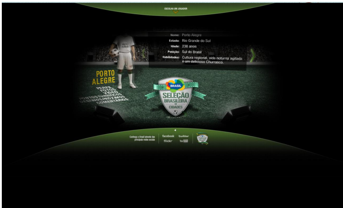
Imagem 3 – Página inicial de visualização de Porto Alegre