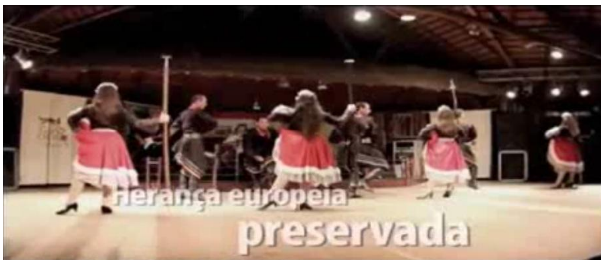
Imagem 10 — Trecho do vídeo sobre Porto Alegre – “Herança europeia preservada”