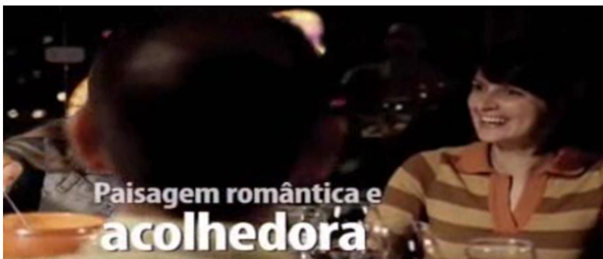
Imagem 7 – Trecho do vídeo sobre Porto Alegre e Região Serrana – “Paisagem romântica e acolhedora”