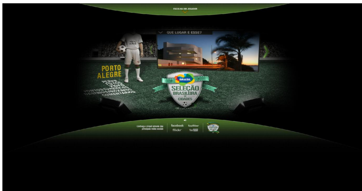
Imagem 5 - Página de visualização de fotos de Porto Alegre e Região Serrana