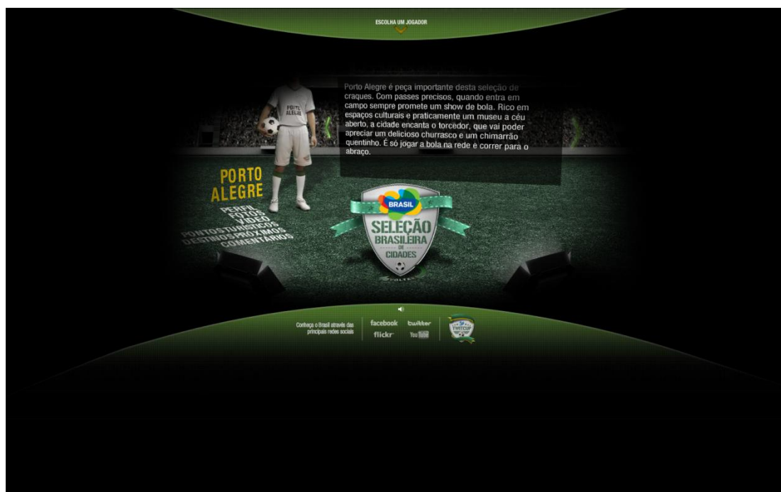
Imagem 4 – Página de visualização do perfil de Porto Alegre