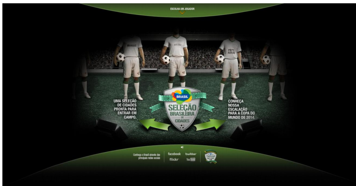
Imagem 2 - Página de escolha da cidade