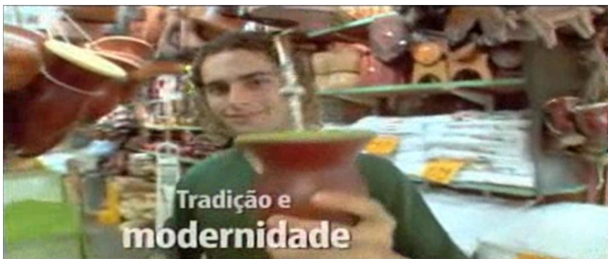
Imagem 6 - Trecho do vídeo sobre Porto Alegre e Região Serrana – “Tradição e modernidade”

Para a reflexão sobre o “vídeo” de um minuto que apresenta imagens de Porto Alegre e da Região Serrana, organizamos a análise em cinco subseções, em consonância com as imagens selecionadas, que contemplam a primeira cena dos enunciados verbais que a integram: “Tradição e modernidade”, “Paisagem romântica e acolhedora”, “Experiências únicas”, “Diversão para todos” e “Herança européia preservada”.