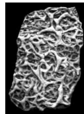
Vestígio fóssil de resina

O Museu de Ciências e Tecnologia (MCT), no seu terceiro pavimento, inaugurou no dia 17/3 a exposição Arte Fóssil . A mostra é composta por mais de 40 reproduções de vestígios fósseis em superfícies rochosas do mundo inteiro, pertencentes ao Instituto de Geologia da Universidade de Tübingen (Alemanha). O acervo resulta do trabalho da equipe do paleontólogo alemão Adolf Seilacher, vencedor do prêmio Crafoord da Academia Sueca de Ciências (Prêmio Nobel alternativo). O pesquisador, que esteve presente à cerimônia, ministrou um curso de extensão sobre o assunto na Universidade. Seilacher foi condecorado com o Crafoord por seu pioneirismo em confeccionar cópias leves e transportáveis de grandes superfícies rochosas, preservando assim o meio ambiente. A exposição ocorre até junho. Informações: 3320-3597 ou no site www.mct.pucrs.br .