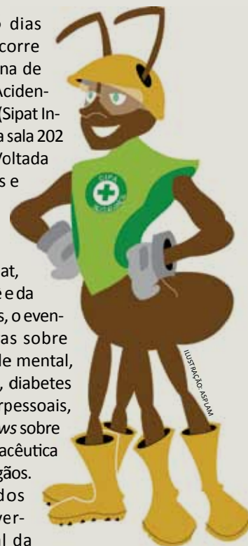
ILUSTRAÇÃO: ANA M

ENTRE OS dias 17 e 21/10 , ocorre a Semana Interna de Prevenção de Acidentes de Trabalho (Sipat Integrada 2011) na sala 202 do prédio 40. Voltada para professores e técnicos administrativos da PUCRS, do Colégio Champagnat, da Gráfica Epecê e da Divisão de Obras, o evento traz palestras sobre estresse e saúde mental, meio ambiente, diabetes e relações interpessoais, além de talkshows sobre assistência farmacêutica e doação de órgãos. Os interessados devem inscrever-se pelo portal da