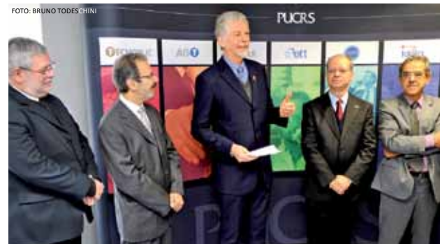
Autoridades no pré-lançamento do evento, em agosto