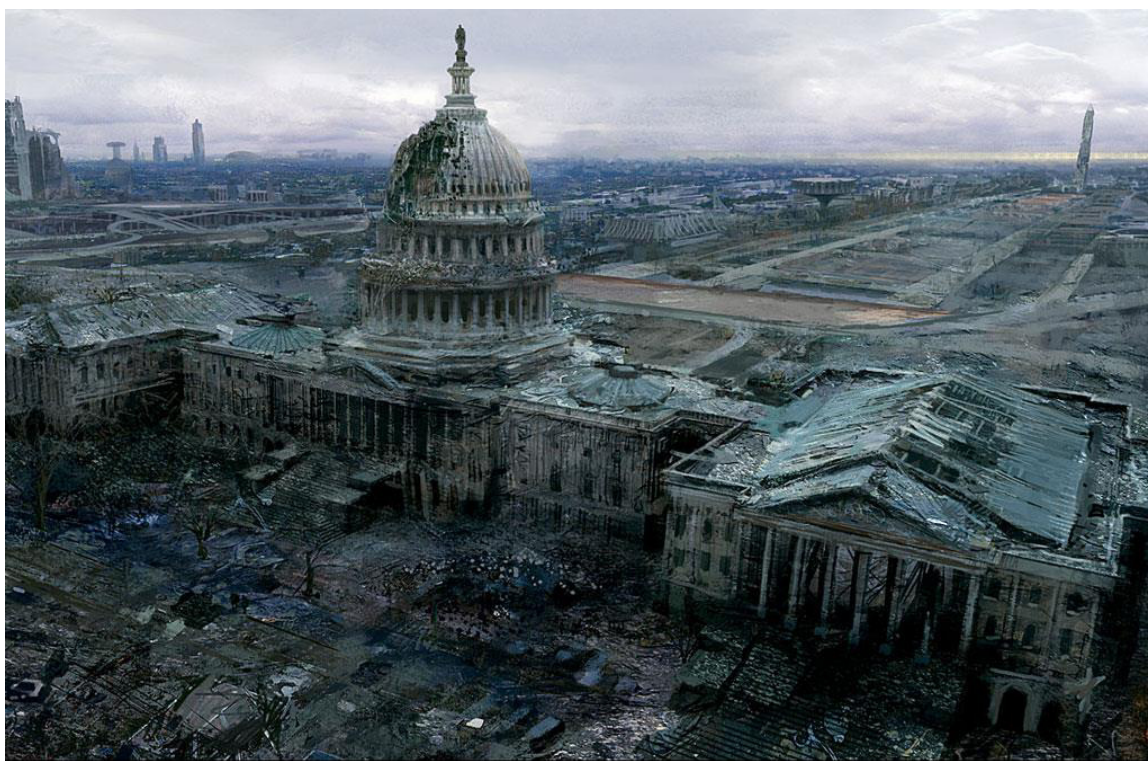
Figura 7: Capital Wasteland