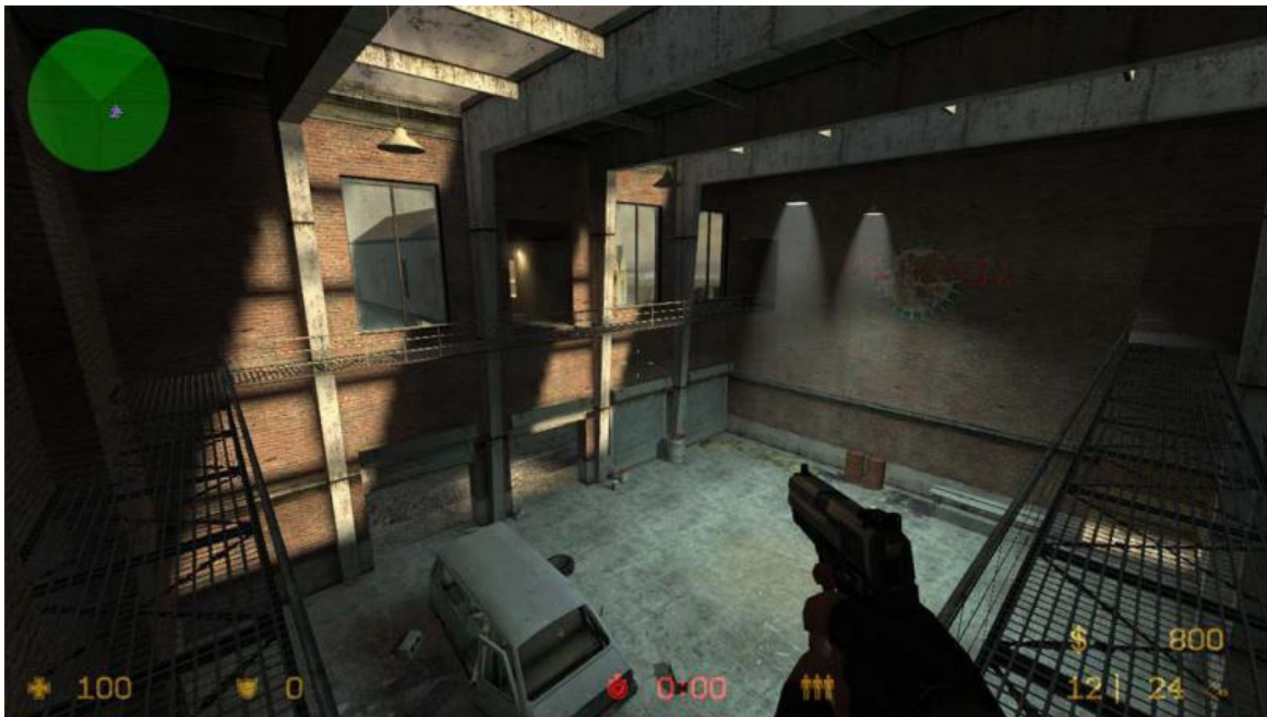
Figura 2: Cena de Counter-Strike com HUD e radar (topo esquerdo)