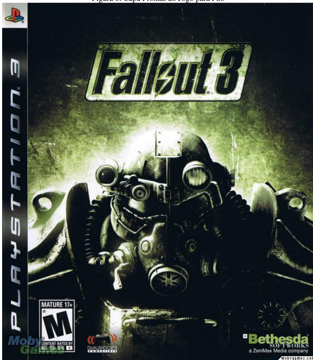
Figura 6: Capa Frontal do Jogo para PS3