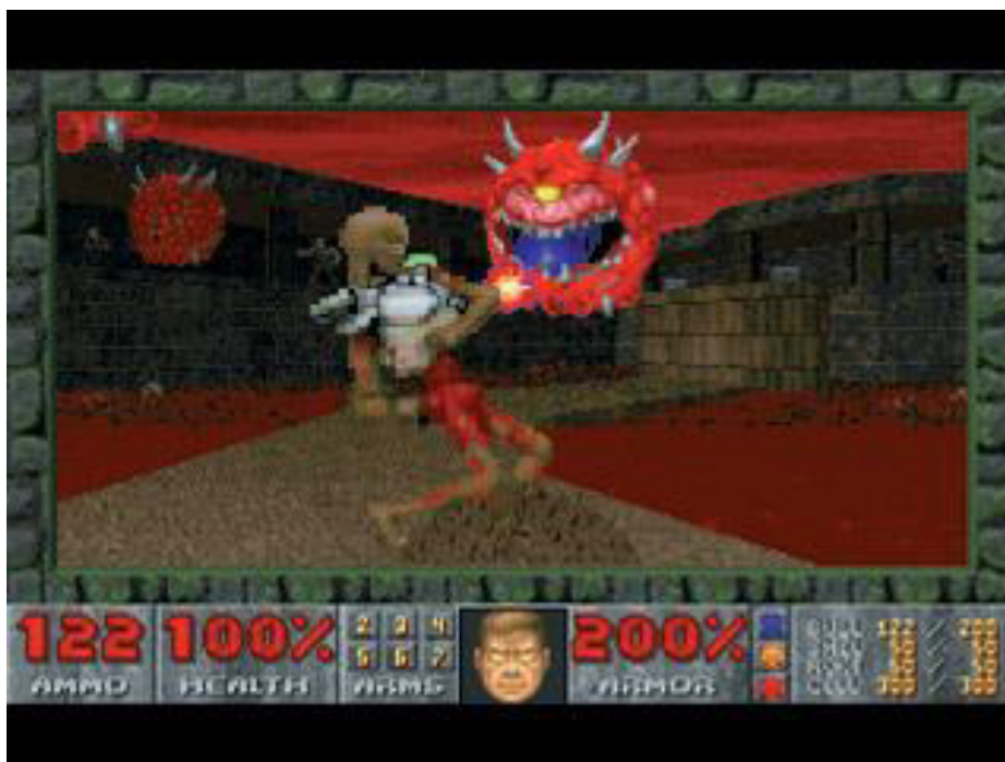
Figura 1: HUD do DOOM