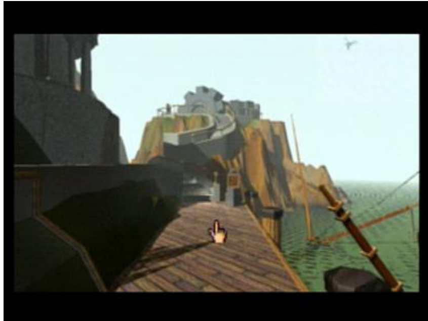
Figura 3: Primeira cena na Ilha de Myst e o cursor (representado pela mão)