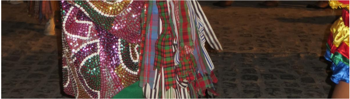
Imagem 1: Trajes

Fonte: Acervo pessoal, fev. 2015. Tamandaré/PE.