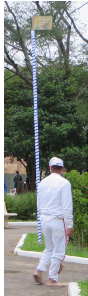
Imagem 3: Mastro

A transformação do espaço também é perceptível durante a procissão do Maçambique 20 de Osório. A festa é uma cerimônia de pagamento de promessas para louvar Nossa Senhora do Rosário. Sempre há promessas a pagar, visto que cada filho desta família é prometido já em nascimento. Atualmente, o festejo dura 4 dias. No primeiro dia, ocorre o levantamento do mastro: é a instalação do tempo da festa. O mastro é instalado em frente à igreja central da cidade de Osório, e parte dessa celebração acontece quando o rei e a rainha - acompanhados dos alferes da bandeira - realizam um cortejo por algumas ruas centrais da cidade. Formam o cortejo: o rei e a rainha, os alferes e três ou quatro casais de festeiros homenageados do ano, três tamboreiros, os dois capitães e os dançantes. Enquanto parte do grupo caminha e leva bandeiras para a Santa, os tamboreiros e capitães cantam versos e os dançantes respondem, ao realizar a dança que caracteriza a manifestação.