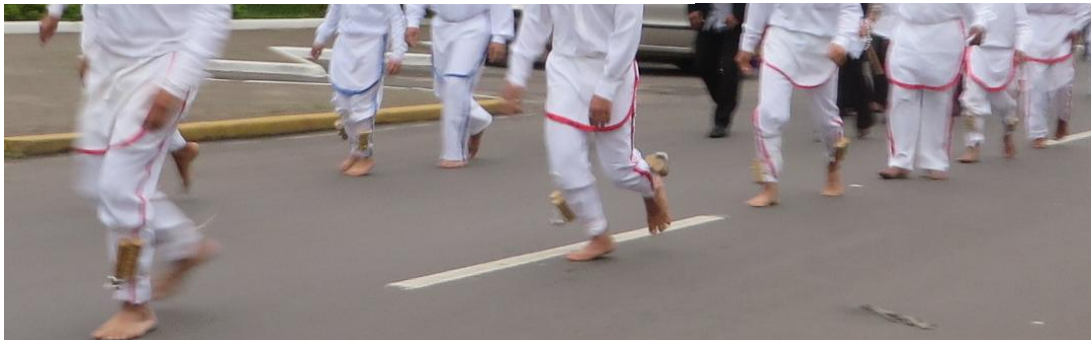
Imagem 4: Dançantes

Fonte: Acervo pessoal, out. 2015. Osório/RS