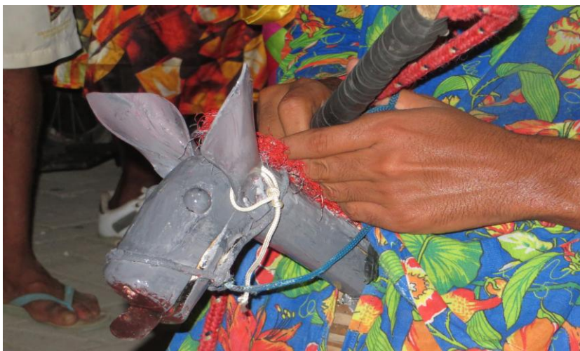
Imagem 2: Burrinha