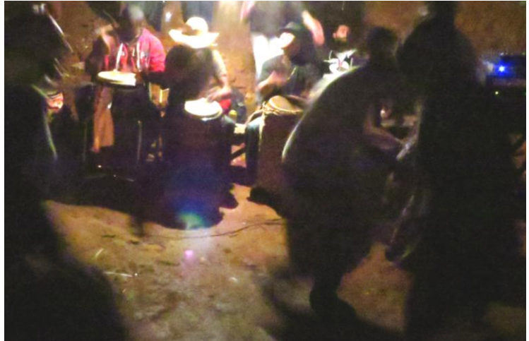
Imagem 5: Roda de Jongo: dança e tambores.

Fonte: Acervo pessoal, jun. 2015. Guaratinguetá/SP.