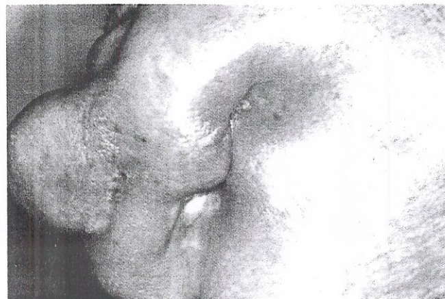
Figura 3 – Deformidade facial permanente, em região submandibular, causada por osteorradionecrose.