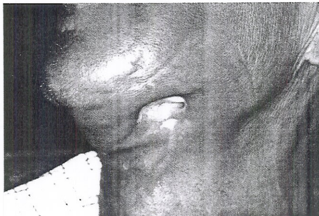
Figura 2 – Aspecto clínico de osteorradionecrose mandibular exibindo fistula extra-oral.